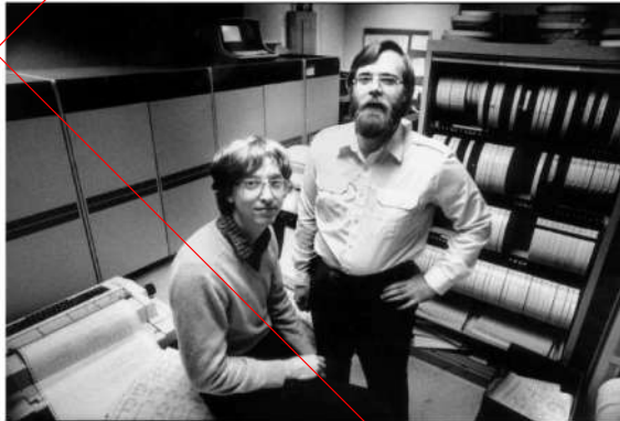
In 1975, Bill Gates and Paul Allen founded Microsoft, with just a few resources and some garage space.